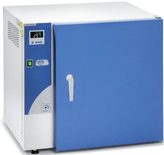
Modelos Conterm, códigos 2000250, 2000251 y 2000253.

CARACTERÍSTICAS, PANEL DE MANDOS, SEGURIDAD, NORMAS Y ACCESORIOS (ver págs. 196 y 197).