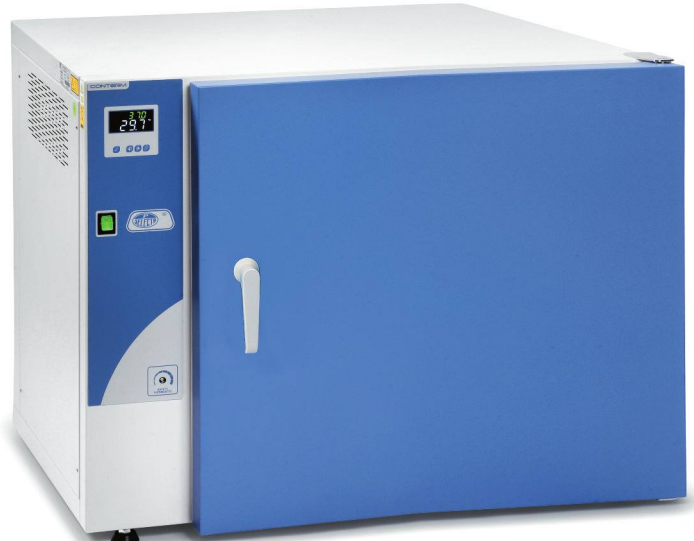
Modelo Conterm tipo Poupinel, códigos 2000252 y 2000254.