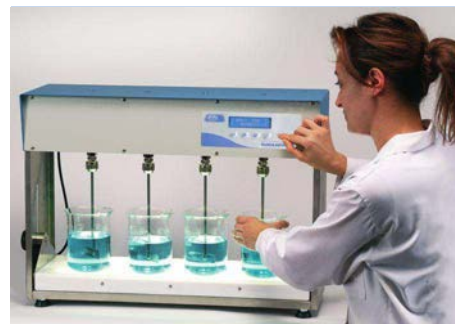
Floculador “Flocumatic” con elementos de iluminación en posición horizontal. 4 plazas.